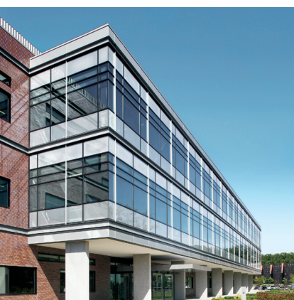
Sistema di porte Schüco in alluminio ADS 65 HD Schüco Aluminium door system ADS 65 HD

Sistema per porte in alluminio Aluminium Door System