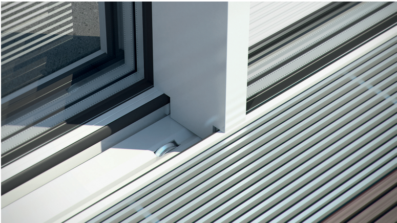
Dettaglio esterno Detail view outside