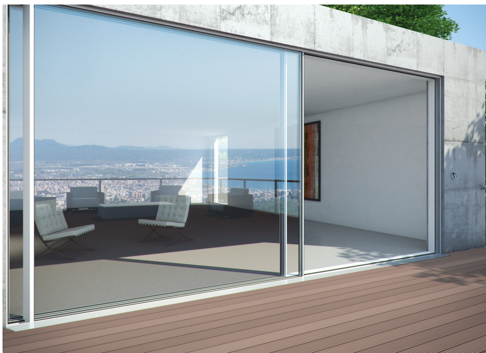
Vista dall'esterno View from outside

The Schüco ASS 77 PD.HI system makes large-scale sliding systems with maximum transparency possible. Slender profile face widths and outstanding thermal insulation win over architects and clients.