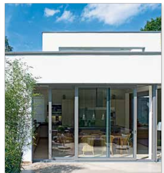
Porte con ante scorrevoli a ribalta per spazi abitativi molto luminosi