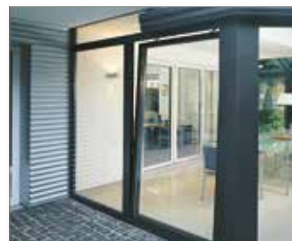
Porta PASK in posizione a ribalta