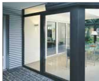
Porta PASK chiusa

L'utilizzo fino a tre guide, consente la realizzazione di ampie aperture e quindi un impiego versatile nelle costruzioni in vetro, come ad esempio le verande.