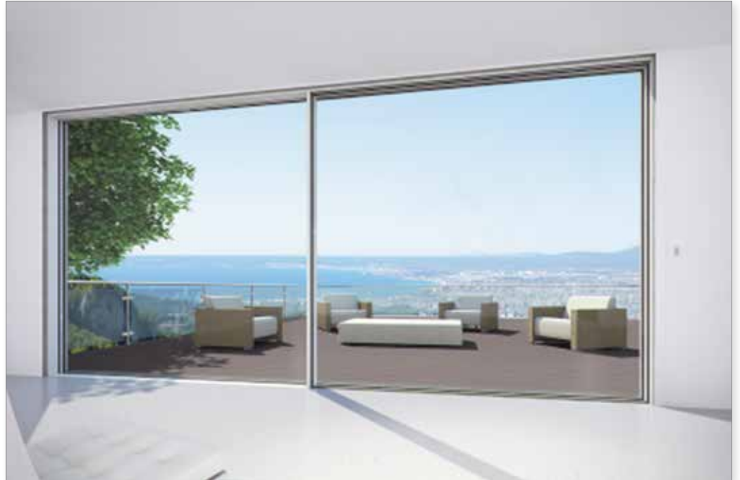
Sistema Schüco ASS 77 PD ad elevato isolamento termico

I profili in alluminio, isolati termicamente, sono dotati di distanziali isolanti e guarnizioni ad elevata efficienza.