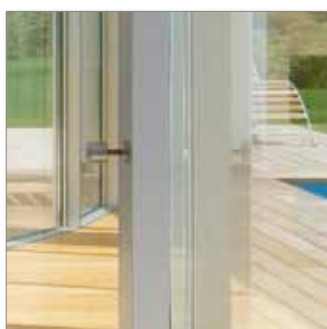
Dispositivo di bloccaggio delle ante in acciaio inossidabile da inserire in corrispondenza del montante centrale. Permette di raggiungere la classe di resistenza 2