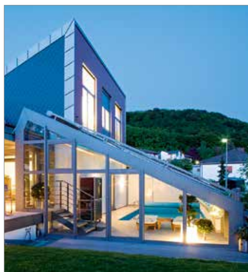
Verande con elementi scorrevoli che collegano casa e giardino