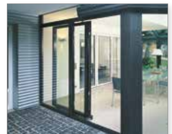
Porta PASK aperta